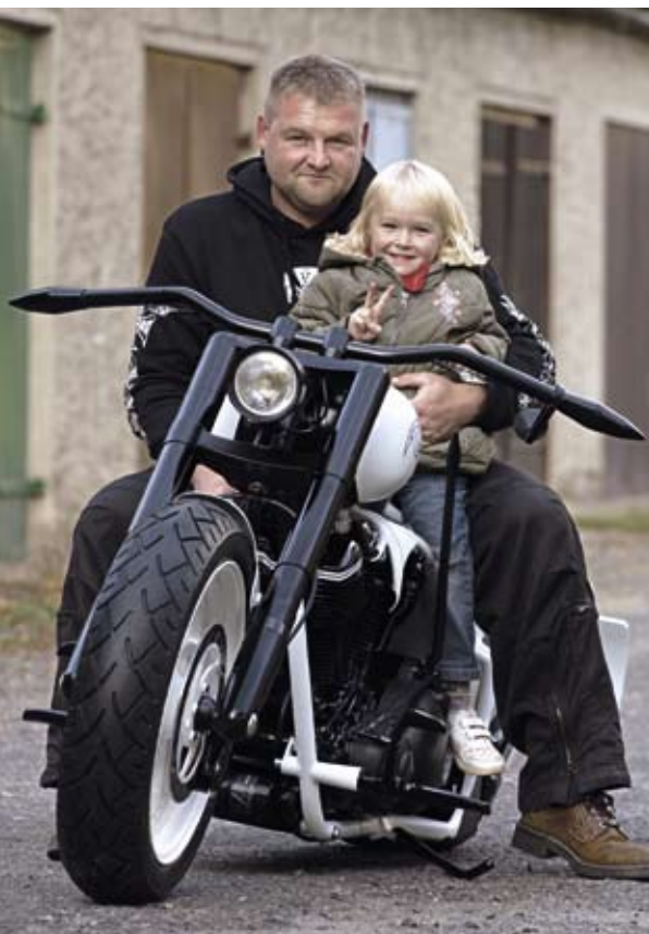
Familienkombi: Normens Tochter freut sich mindestens genauso über den neuen Untersatz

Raumgreifend wie das Imperium Romanum: ein Lenker, geschmiedet wie eine futuristische Waffe